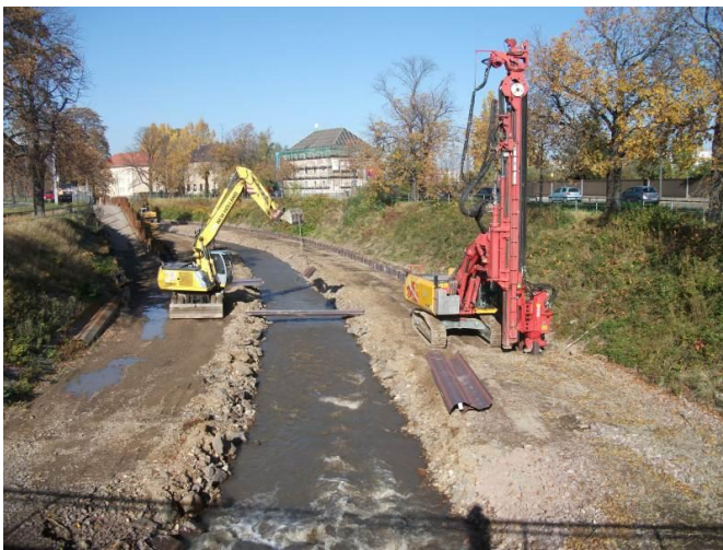
Abb.: Weißeritzausbau in Dresden Löbtau

Im Vorfeld des gegenwärtigen Gewässerausbau wurden ein Abwasserkanal umverlegt, Brückenfundamente gesichert und Gewässerzufahrten errichtet. Im Anschluss erfolgte die Sicherung der bestehenden Böschungen, welche eine Grundvoraussetzung für die geplante Gewässereintiefung ist. Die genannten Maßnahmen sind weitestgehend abgeschlossen und es wurde im September bereits mit dem Ausbau selbst begonnen. Die Arbeiten werden voraussichtlich bis 2015 andauern.