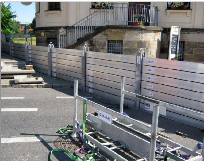
Abb.: Querung Terrassenufer

Beim ersten Probeaufbau wurden die Anlagen in der Schlachthofstraße (Dammbalken) und an der Einfahrt zum Alberthafen (Schiebetor) getestet. Sehr anspruchsvoll und mit merklichen Straßensperrungen verbunden war die Funktionsprobe der beiden großen Schiebetore am Ostra-Ufer und der Weißeritzstraße. Zu dem Termin am 29. Juli wurden außerdem das Stemmtor am Heinz-Steyer-Stadion betätigt und die Dammbalken am Stadion eingesetzt. Der dritte Termin blieb dem Aufbau der Dammbalken am Terrassenufer in Höhe Basteischlösschen/Italienisches Dörfchen vorbehalten.