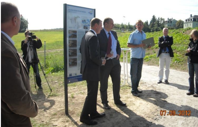
Abb.: Einweihung Hochwasserrückhaltebecken

Durch den Ersten Bürgermeister der Landeshauptstadt Dresden, Dirk Hilbert, und den Staatssekretär des Sächsischen Ministeriums für Umwelt und Landwirtschaft, Dr. Fritz Jaeckel, wurde am 7. September, das Hochwasserrückhaltebecken am Kaitzbach zwischen Altkaitz und Mockritz eingeweiht.