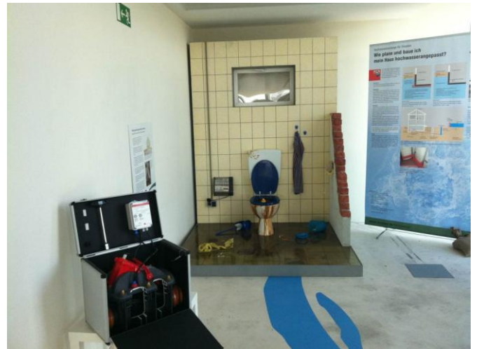
Abb.: Ausstellung, Foto: Umweltamt 2012

Malerei, Fotografie und eine Installation aus. Die Werke bezogen sich nicht allein auf die Flut vor zehn Jahren, sondern setzten sich in einem erweiterten Sinne mit dem Thema Naturgewalten auseinander.