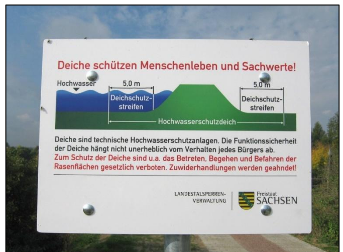
Abb.: Schild am neuen Deichschutzstreifen