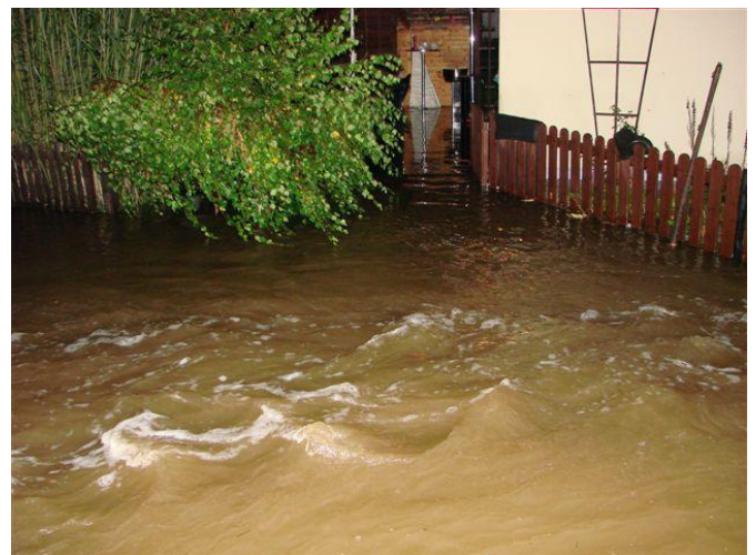
Abb.: Überflutungen am 16.08.2010

Die Anlieger des Schullwitzbaches waren in der Vergangenheit schon oft Gefahren durch Hochwasser ausgesetzt. Seit 2002 wurden deshalb mit einer Vielzahl von Maßnahmen im Umfang von rund 2,5 Millionen Euro der vorsorgende Hochwasserschutz schon wesentlich verbessert.